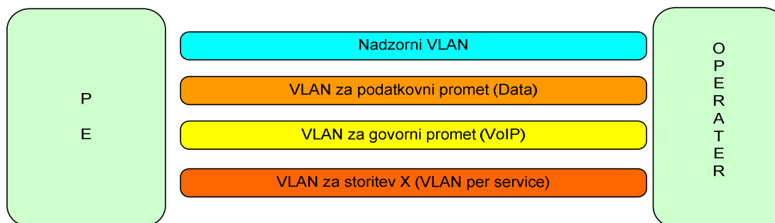
Slika 2: Logična konfiguracija povezave Telekom Slovenije – operater

Telekom Slovenije bo operaterju zagotovil povezavo oziroma priključno točko na omrežje Telekoma Slovenije v skladu s cenikom Telekoma Slovenije. Vzpostavljenih bo več VLAN-ov (IEEE 802.1Q, 802.1D); podatkovni VLANi ( za vsako koncentracijo prometa ločeni VLAN) ter kontrolni VLAN. VPN promet se mapira na L2 VLAN »DATA« proti operaterju. VPN promet se preslika v podatkovni VLAN proti operaterju. Kontrolni promet (komunikacija med RADIUS strežnikoma Telekoma Slovenije in operaterja) se preslika v kontrolni VLAN proti operaterju. Oprema za to povezavo mora biti kompatibilna z omrežno platformo Telekoma Slovenije.